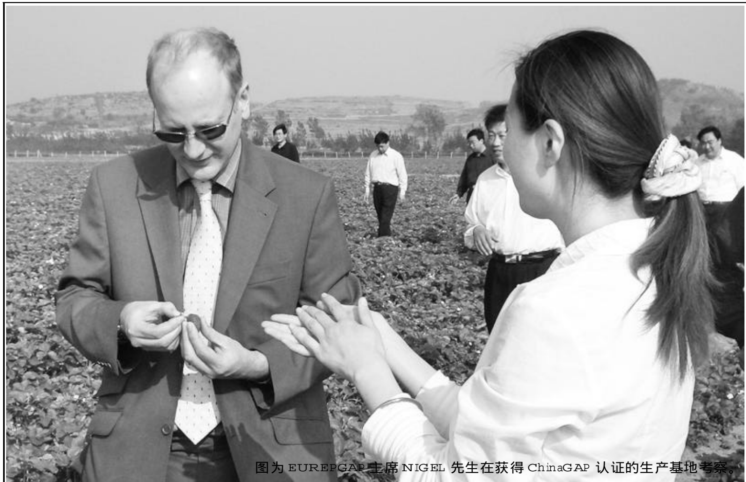
图为 EUREPGAP 主席 NIGEL 先生在获得 ChinaGAP 认证的生产基地考察。

为了进一步促进农产品生产企业的出口,国家认监委正在积极推广 ChinaGAP 认证,目前已经同 EUREPGAP 组织签署了备忘录,并正在开展认证比较方面的合作。通过基准比较后,获得 ChinaGAP 认证的企业,将会得到 EUREPGAP 组织的认可,可以同获得 EUREPGAP 认证的其他国外企业一样进入欧洲市场。而 EUREPGAP 认证是目前农产品进入欧洲市场的“准入证”。