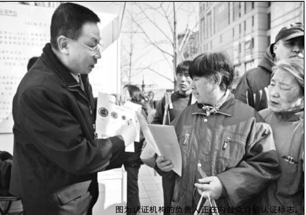
图为认证机构的负责人正在向公众介绍认证标志。