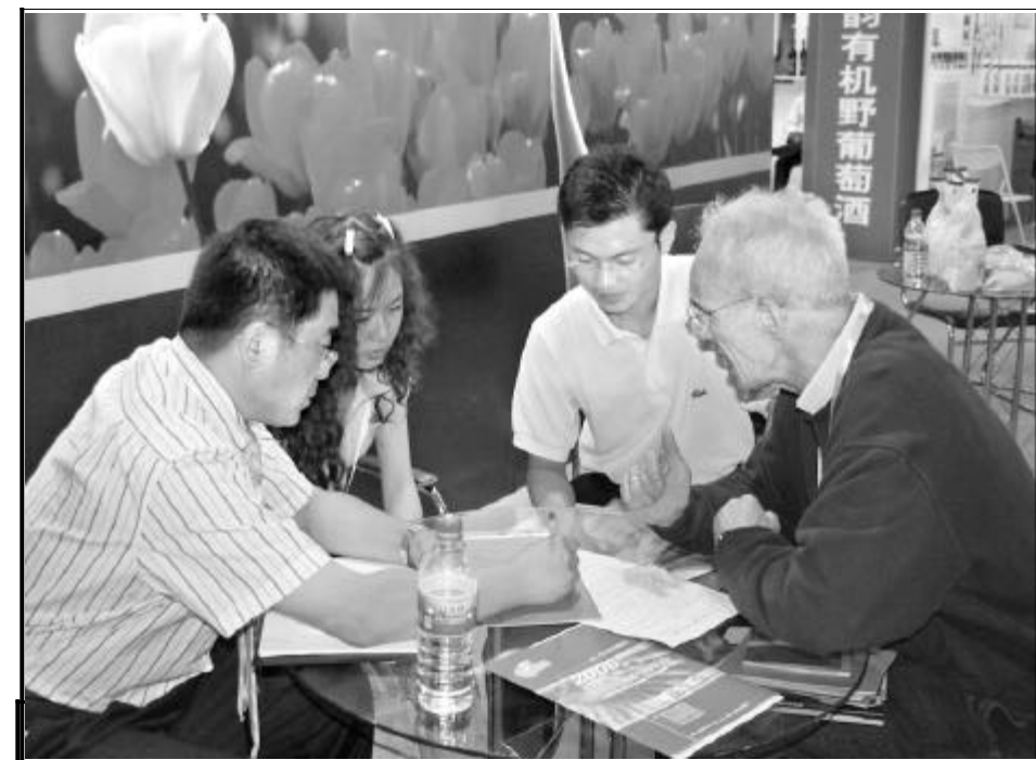
图为在 2006 年有机产品展览会上,认证机构负责人向外国客商介绍中国有机产品认证情况。

监委连续举办“中加小农项目中国西部地区食品实验室人员培训班”,对农业、卫生、药监和质检系统检验检测人员进行培训,提升了我国尤其是西部地区食品安全检验检测水平,推动了部门和地区间技术交流与合作。在大力引导和推动相关工作开展的同时,